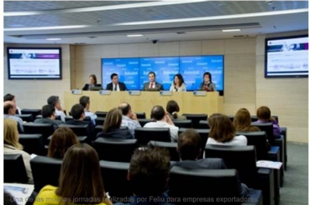
Una de las muchas jornadas realizadas por Feliu para empresas exportadoras

Desde el 2005, FELIU N&I como consultoría en internacionalización especializada en Latinoamérica, Estados Unidos y Europa, está asesorando y acompañando a empresas en sus proyectos de implantación en el exterior.